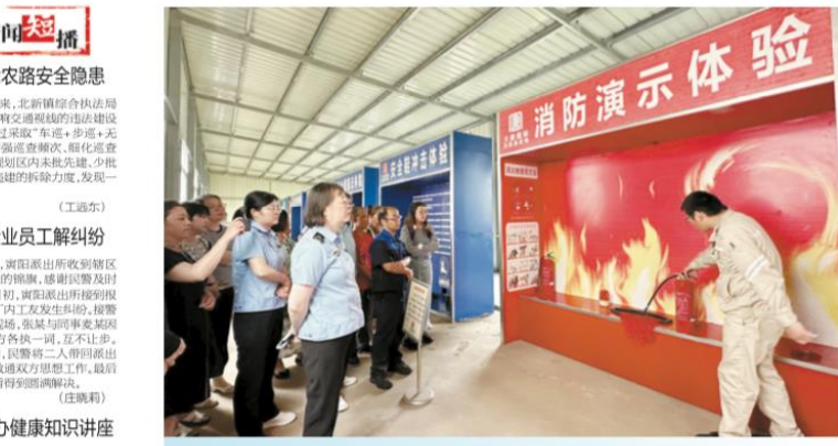
6月30日,向阳镇企业单位代表30余人参观江苏大唐国际启东发电有限公司安全体验馆,通过沉浸式体验安全消防知识,安全使用、正确操作、心肺复苏设备使用、消防器材使用等,掌握安全防范措施和逃生自救技巧,提高突发事件的应对能力。

请符合城河新村拆迁户子女女孩批销的对象,于2023年7月31日前提供完整资料,交到拆迁指挥部进行初审,逾期不予受理,今后不再接收。特此公告 启东市汇龙镇城河新村村民委员会 2023年7月3日