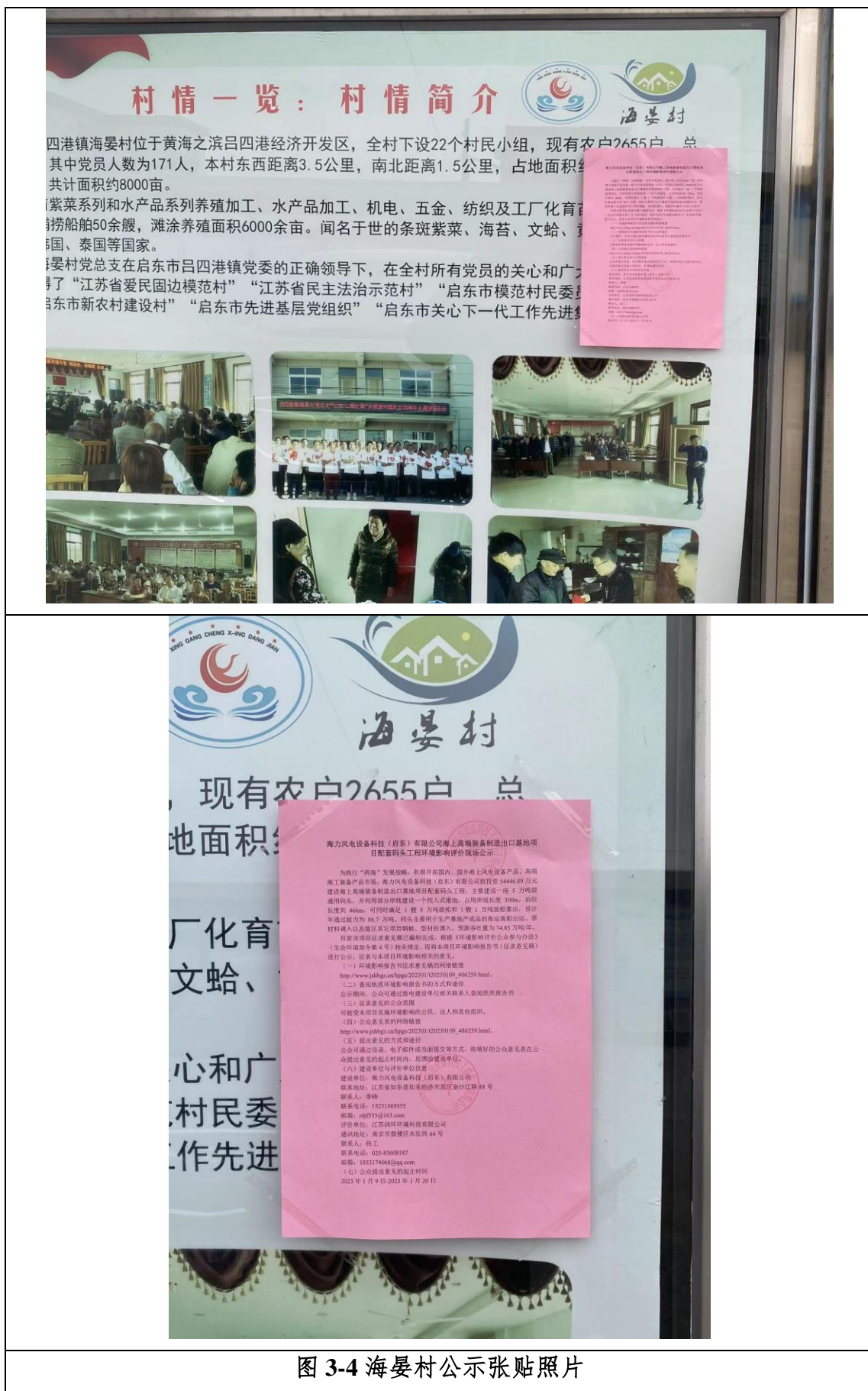
图 3-4 海晏村公示张贴照片