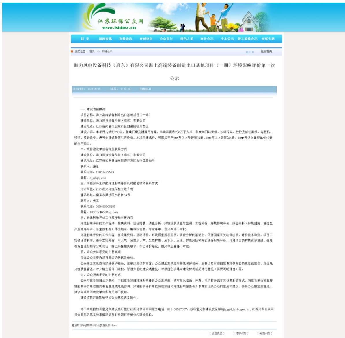
图 2-1 首次环境影响评价信息网络公示截图

网络选取的符合性分析：“江苏环保公众网”是由江苏省环保宣教中心全力打造的面向公众的环保网站，符合《环境影响评价公众参与办法》对网络平台的要求。