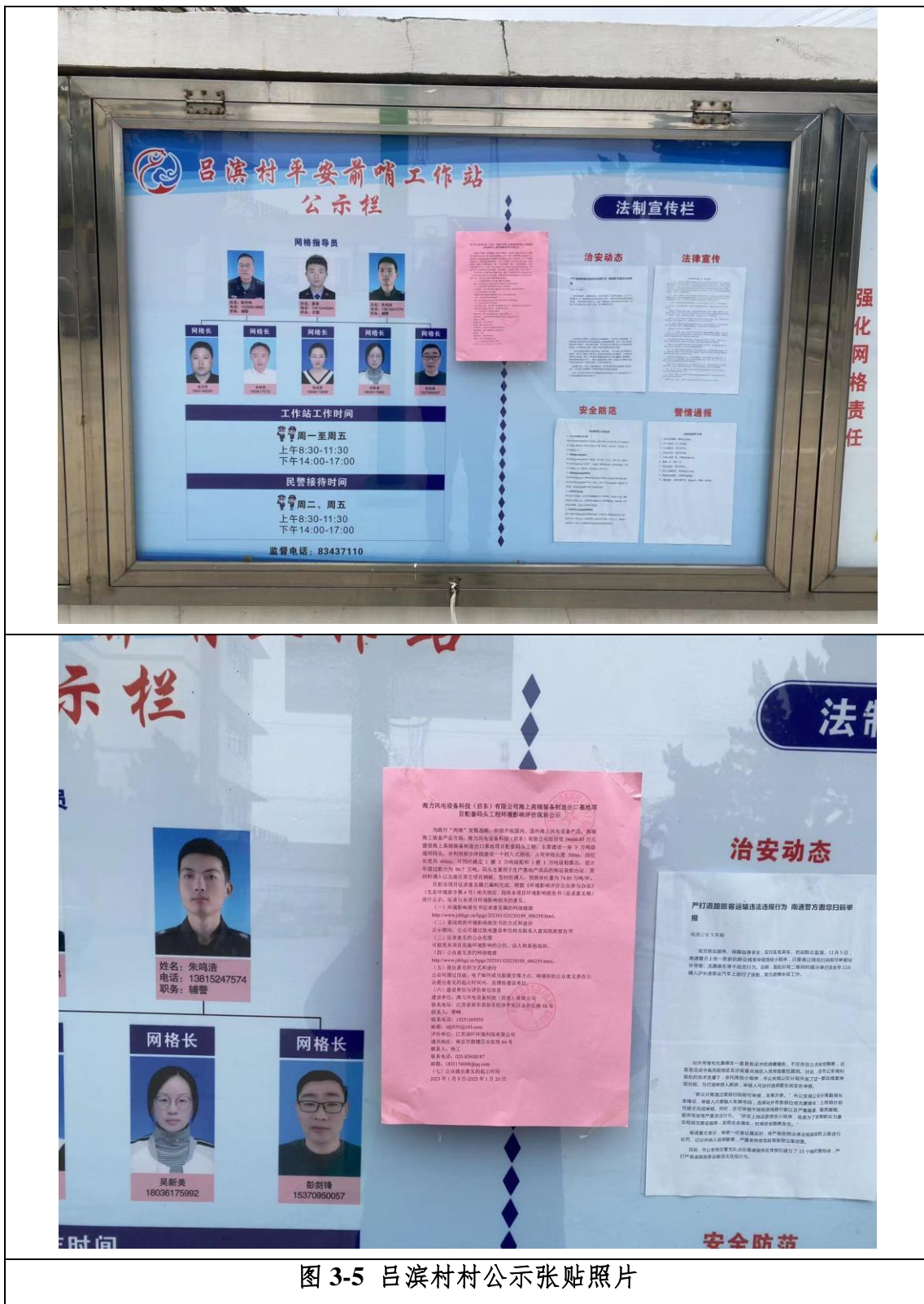
图 3-5 吕滨村村公示张贴照片