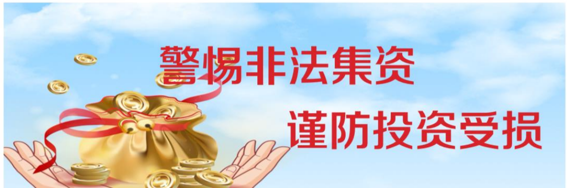
图 3-2 第一次报纸刊登公示截图