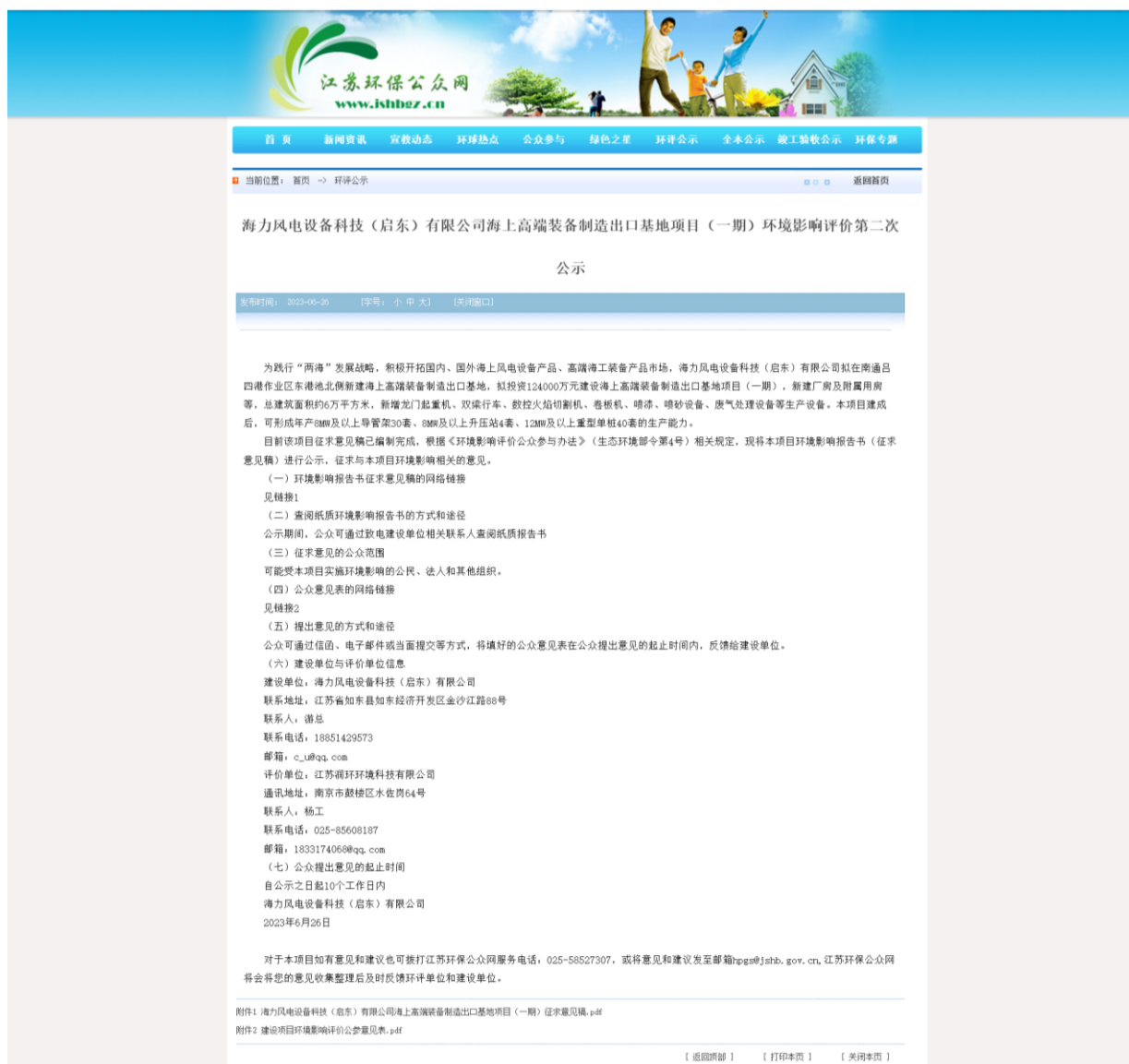
图 3-1 征求意见稿公示截图